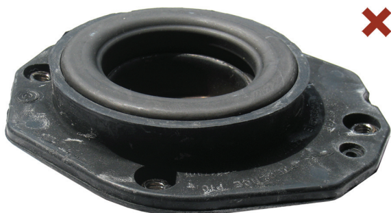
Fig. 1: Chybně namontované opěrné ložisko pružné vzpěry

Citroën Berlingo / Xsara / ZX Peugeot 306 / Partner