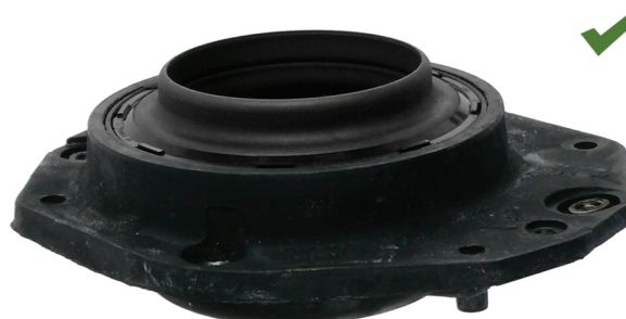
Fig. 2: Správně namontované opěrné ložisko pružné vzpěry